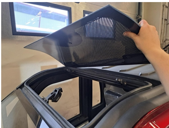
Nosta kattoluukku pois.