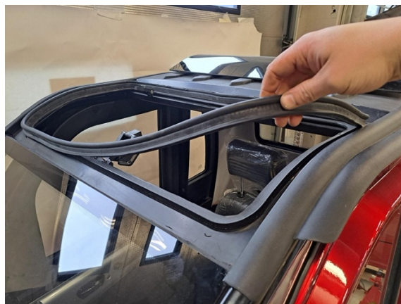
Ota kattoluukun tiiviste pois.

Uuden osan asennus käänteisessä järjestyksessä.